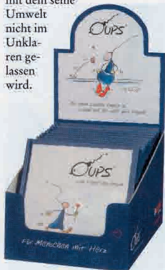
„Oups vom Planet der Herzen“ war der Beginn der Erfolgsstory

Frohe Weihnachten und ein Glückauf 2004!