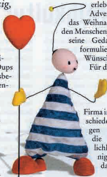
Oups als Stehfigur mit Herz

Für die Präsentation des Oups-Programmes hat die Firma incomix verschiedene Lösungen entwickelt, die Übersichtlichkeit mit wenig Platzbedarf vereinen.