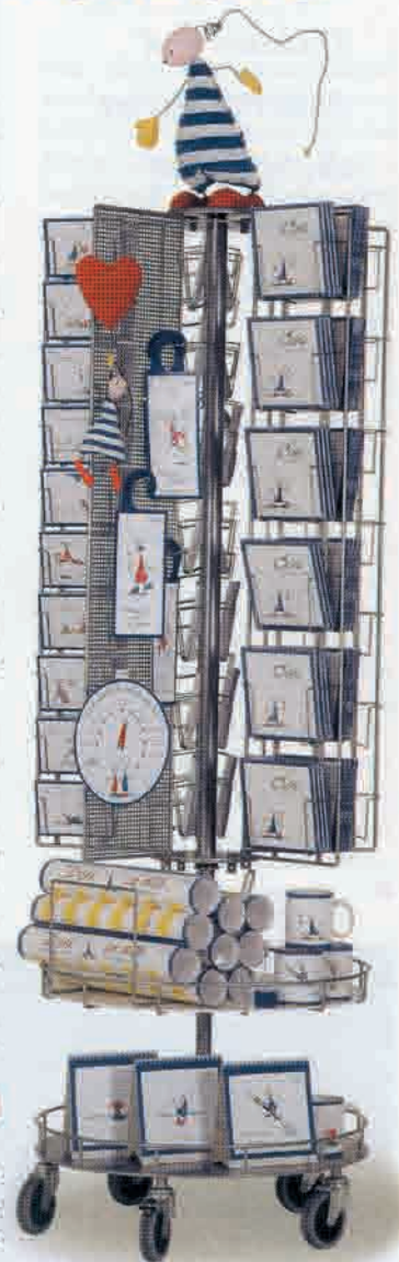
Oups-Produktständer für die Präsentation im Geschäft