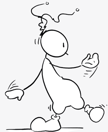
Schüttle dich aus