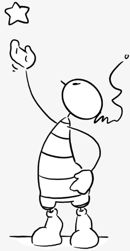
Greife hoch zu den Sternen