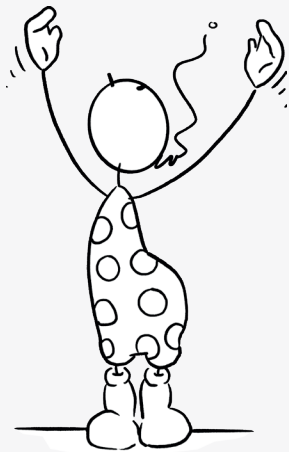
Strecke dich groß und weit