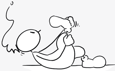
Ziehe dein Knie zum Kinn