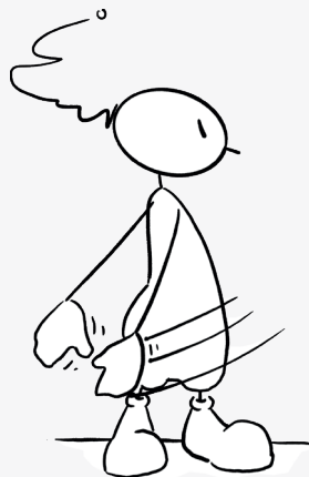
Schwinge deine Arme