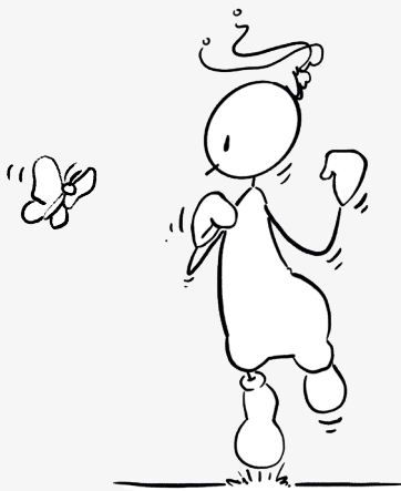
Hüpfe auf der Stelle